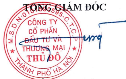
Trần Công Tường